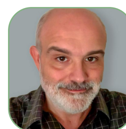
Fatójó, Jaume Vetbonds