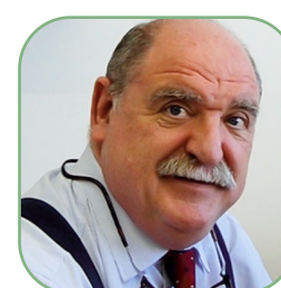
Bulbena, Antoni UAB