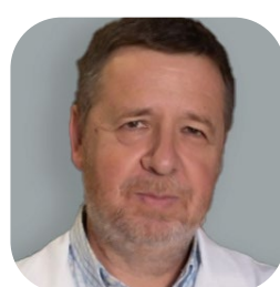
Abella, Francesc Fundació Galatea